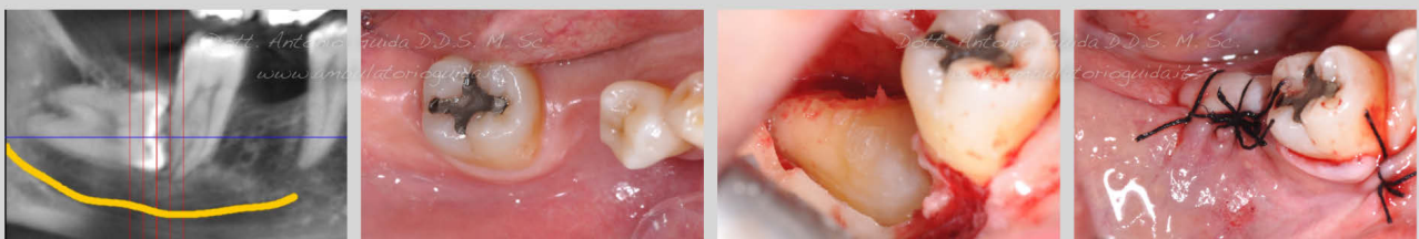
Estrazione di terzo molare in inclusione ossea totale